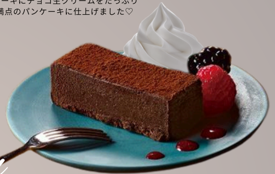
ショコラテリーヌ ¥480

3枚も重ねたパンケーキにチョコ生クリームをたっぷりかけたボリューム満点のパンケーキに仕上げました♡