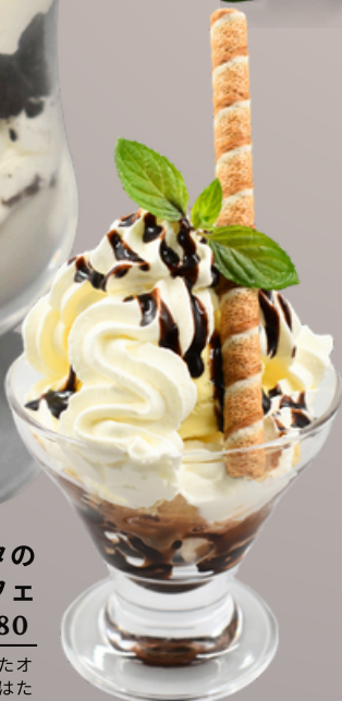
ミニチョコパフェ ¥580