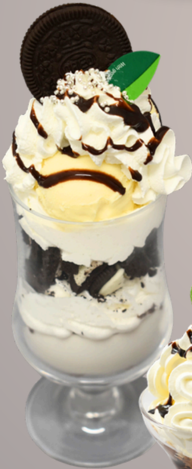
オレオとパナコッタの ザクザクパフェ ¥880

一番下にはパナコッタ、更に砕いたオレオとバニラアイス。甘い物好きにはたまらないボリューム満点のパフェです！